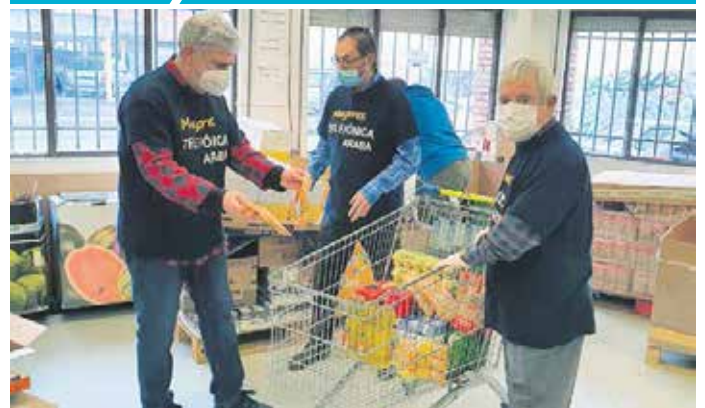
UN TOTAL DE 33 SOCIOS DE LOS 230 QUE FORMAN PARTE DEL GRUPO DE MAYORES DE TELEFÓNICA ARABA COLABORAN CON EL BANCO DE ALIMENTOS.