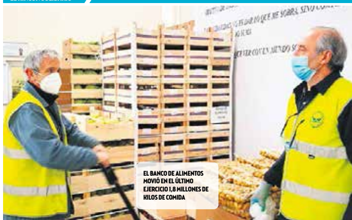
EL BANCO DE ALIMENTOS MOVIO EN EL ÚLTIMO EJERCICIO 1,8 MILLONES DE KILOS DE COMIDA