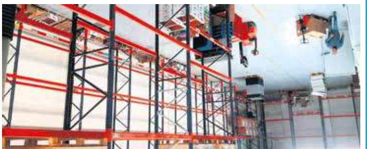
GRAN RECOGIDA DE ALIMENTOS LOS DÍAS 1 Y 2 DE DICIEMBRE

EL HÁMBRE SE PUEDE CURAR! AYUDANOS A CONSEGUIRLO!